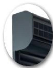
2 x 20°