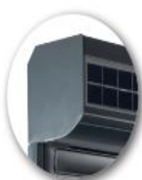
1 x 20°